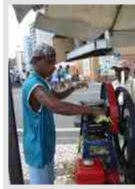
Vendedor de caldo de cana

Neste alaúde, que a saudade afina, Apraz-me às vêzes descantar lembranças De um tempo mais ditoso; De um tempo em que entre sonhos de ventura Minha alma repousava adormecida Nos braços da esperança. Eu amo essas lembranças, como o cisne Ama seu lago azul, ou como a pomba Do bosque as sombras ama. Eu amo essas lembranças; deixam n'alma Um quê de vago e triste, que mitiga Da vida os amargores. (...)